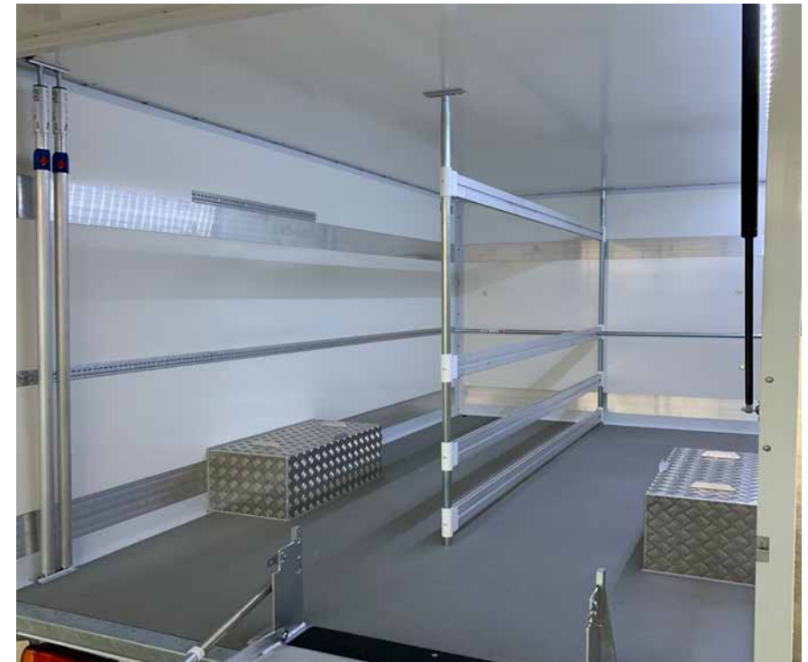
Filialeinteilung nach Kundenwunsch

Zur Filialeinteilung können wir Ihnen unser neues Trennsystem zur Gassenbildung mit bis zu 3 Gassen empfehlen. Die Aufteilung und Ausrichtung der passenden Trenn-/ Absperrlösung können wir nach Ihren Wünschen anpassen. Die Einteilung lässt sich sowohl herausnehmbar, als auch fest verbauen. Nennen Sie uns einfach die Abmessungen Ihrer Ladegüter, um Ihre Wunscheinteilung erfüllen zu können. (siehe Rückseite)