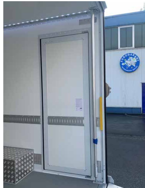
BÄKOLiner Seitentür & Parkposition