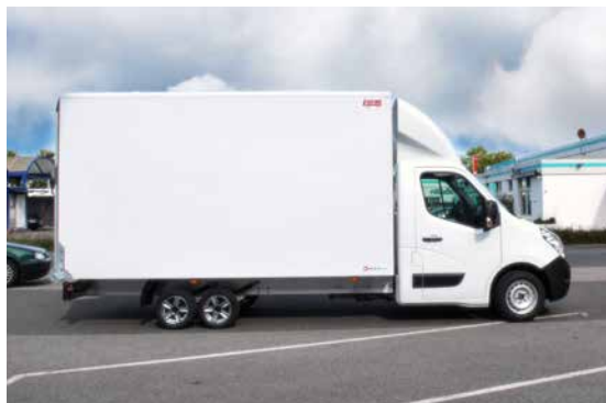
BÄKOLiner auf Basis Tiefrahmenfahrstell